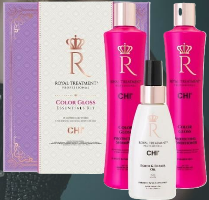
Royal Treatment Color Gloss ESSENTIALS KIT